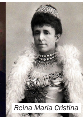
Reina María Cristina