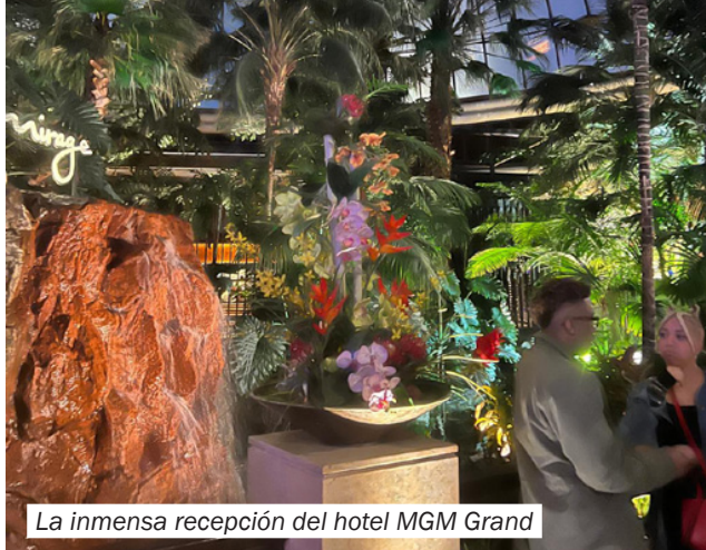
La inmensa recepción del hotel MGM Grand

Buenas y emocionadas noches en Las Vegas, buenos días en España.