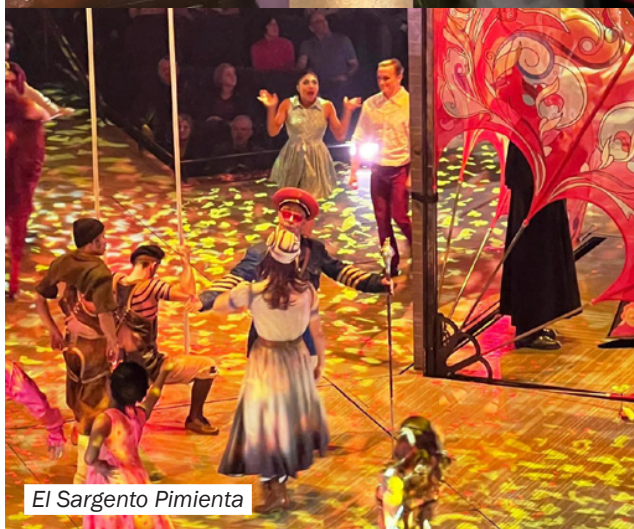
El Sargento Pimienta