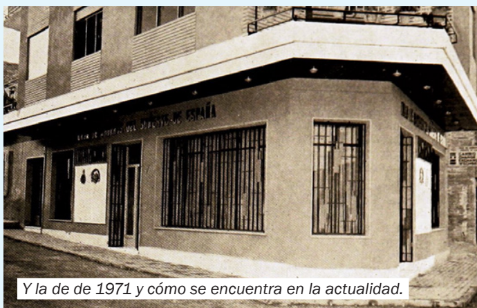
Y la de de 1971 y cómo se encuentra en la actualidad.