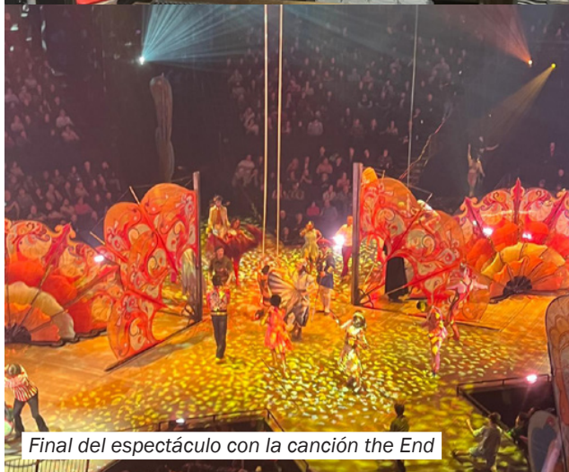
Final del espectáculo con la canción the End