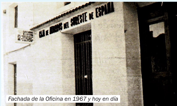
Fachada de la Oficina en 1967 y hoy en día