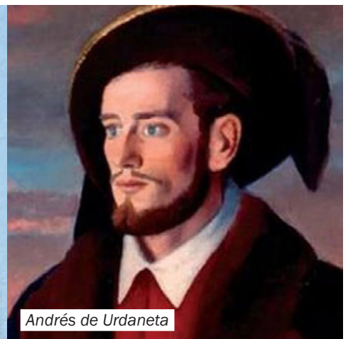
Andrés de Urdaneta