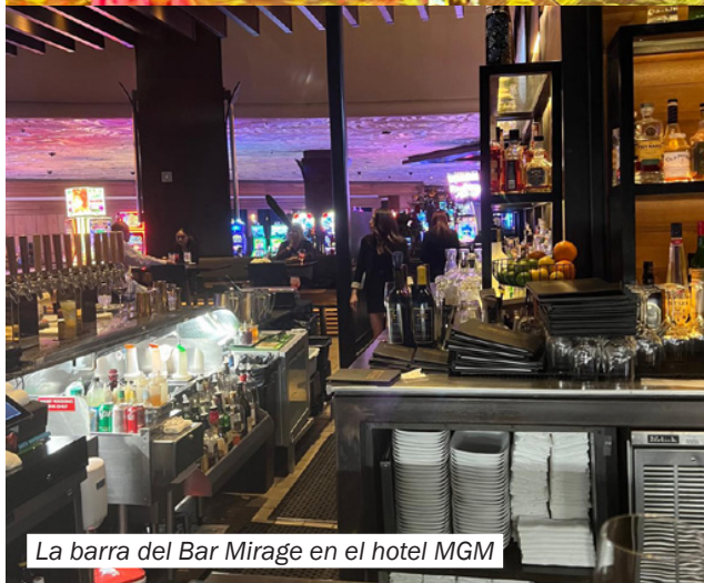
La barra del Bar Mirage en el hotel MGM