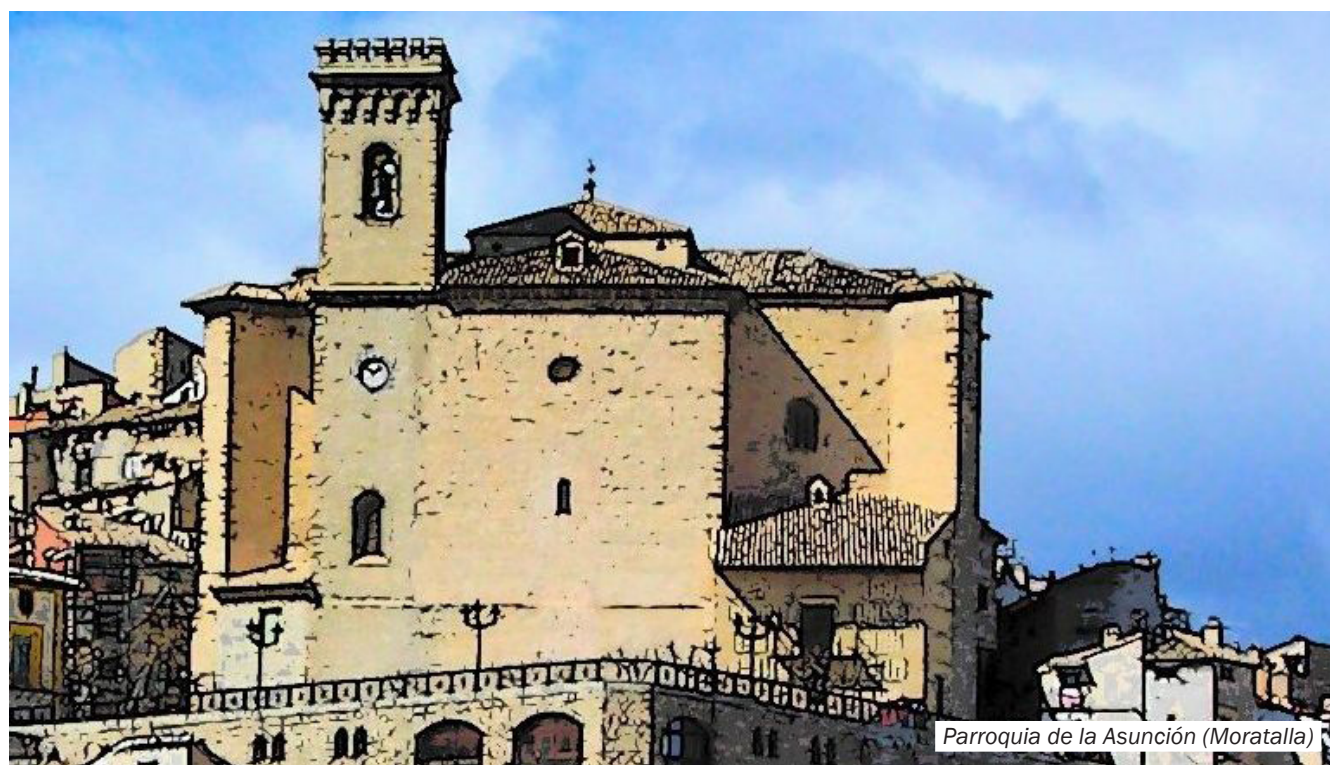
Parroquia de la Asunción (Moratalla)