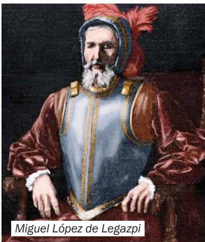
Miguel López de Legazpi